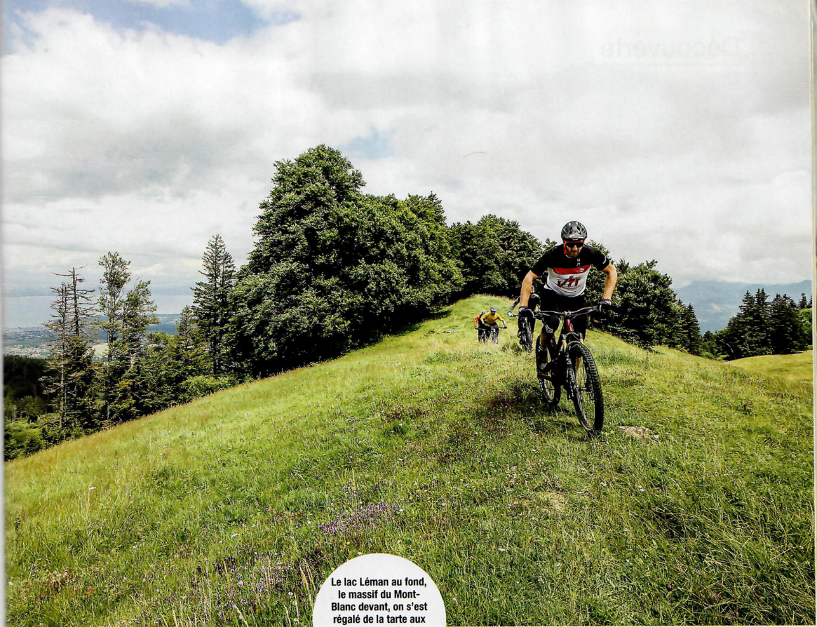
Le lac Léman au fond, le massif du Mont-Blanc devant, on s'est régalé de la tarte aux myrtilles du Petit Savoyard et de cette montagne aux mille visages.